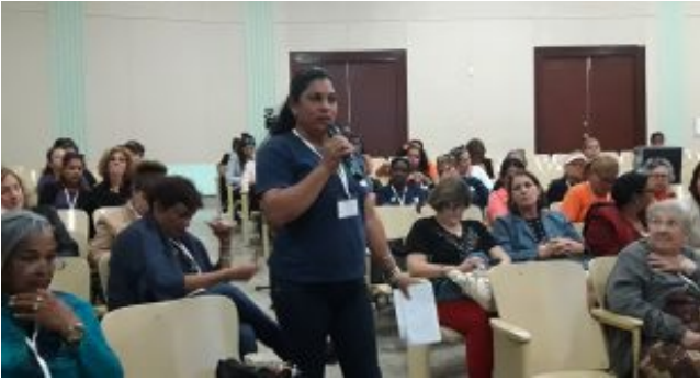
Cuba: Comisiones marcaron inicio de Congreso femenino