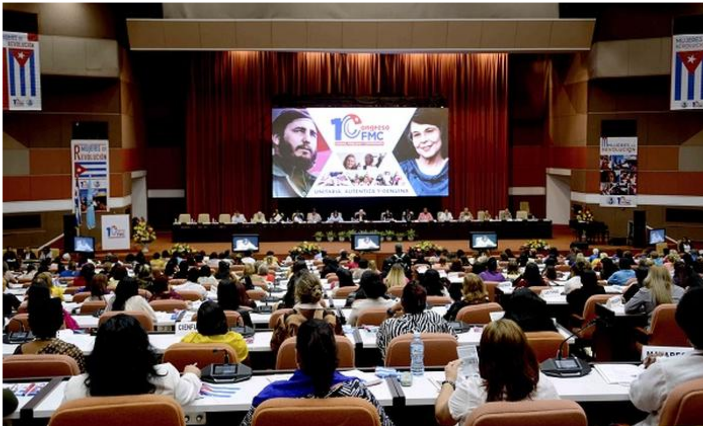
En el X Congreso de la Federación de Mujeres Cubanas, participan 360 delegadas y 40 invitados.

La necesidad de utilizar de manera más eficiente las Tecnologías de la Información y la Comunicación (TIC) para visibilizar el trabajo de la Federación de Mujeres Cubanas fue tema central durante la sesión plenaria de su X Congreso, celebrado en el Palacio de Convenciones de esta capital.