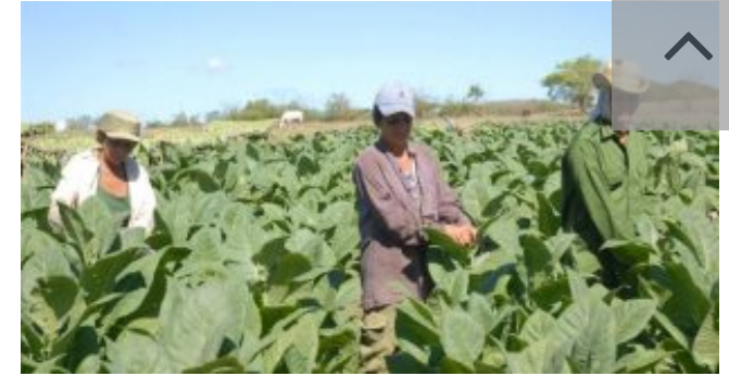
Congreso de la FMC en Sancti Spíritus: Con aroma de mujer