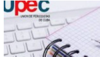
Celebran en Las Tunas aniversario 56 de la UPEC