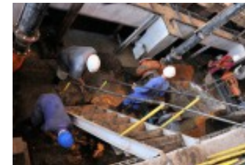
En reparaciones los centrales que en Las Tunas harán zafra