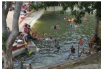
Confort, tranquilidad y belleza a disposición de los azucareros