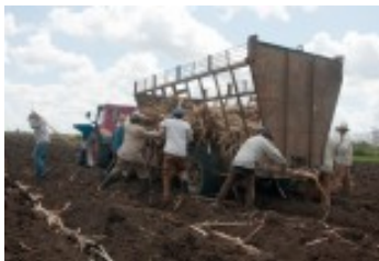
Azucareros de Las Tunas ante un gran reto en siembra de caña