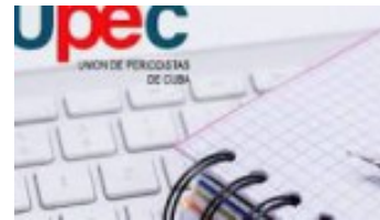
Celebran en Las Tunas aniversario 56 de la UPEC