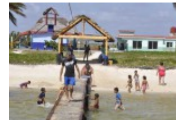
¿Inofensivos?, amores de verano...