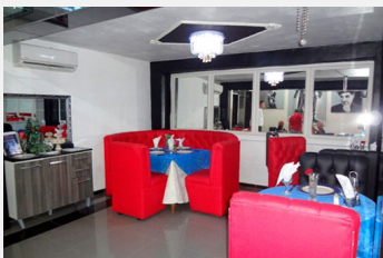
Un Gallardo con trato de primera