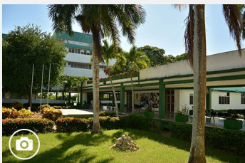
Una escuela que crece