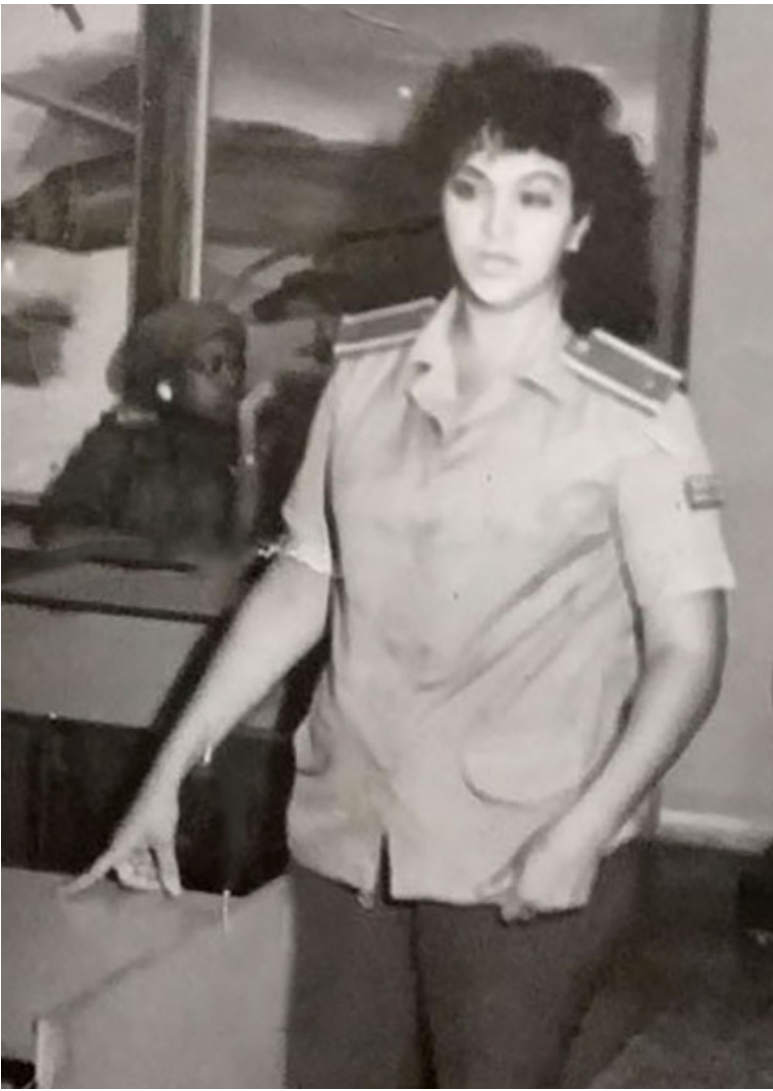
Días de cadete.

“Acepté el ofrecimiento y cuando concluí la previa me incorporé a la Escuela de Pilotos de Aviación donde comenzaron a adiestrarme - hasta que llegará el simulador - y pudiera comenzar mi especialidad. Pero estaba insatisfecha y un buen día pregunté por qué no me incorporaban al Curso de Navegación de aviones de combate.