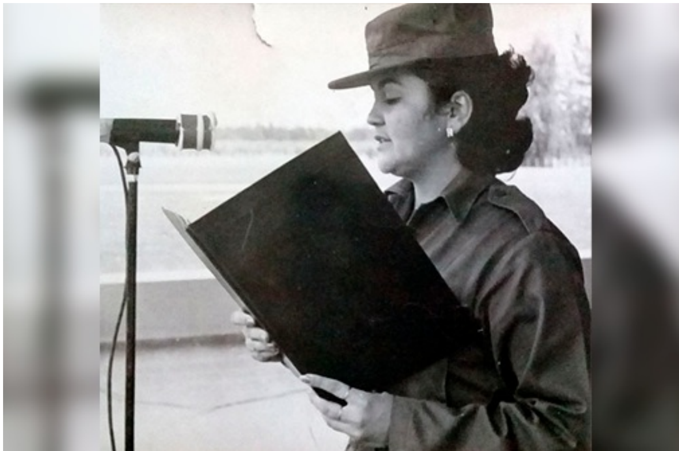
Lectura del Compromiso en la escuela de cadetes.

Septiembre 30, 2019 Escrito por Ramón Brizuela Roque