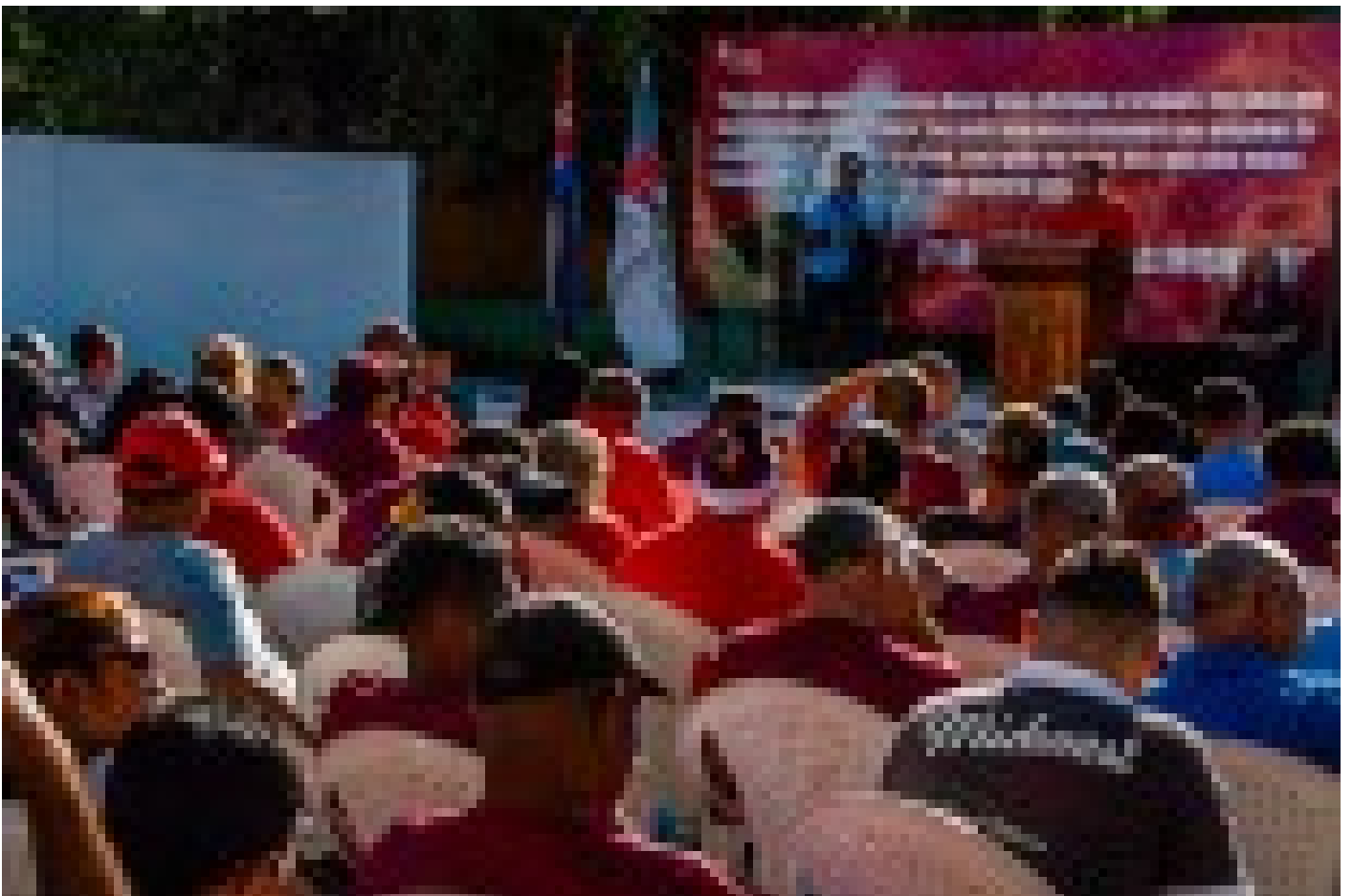
El recuerdo de Fidel no se oxida en el Laminador 200T (+audio y video)