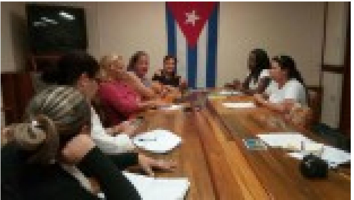
Convocan al empresariado tunero a participar en Plataforma de Soluciones Innovadoras