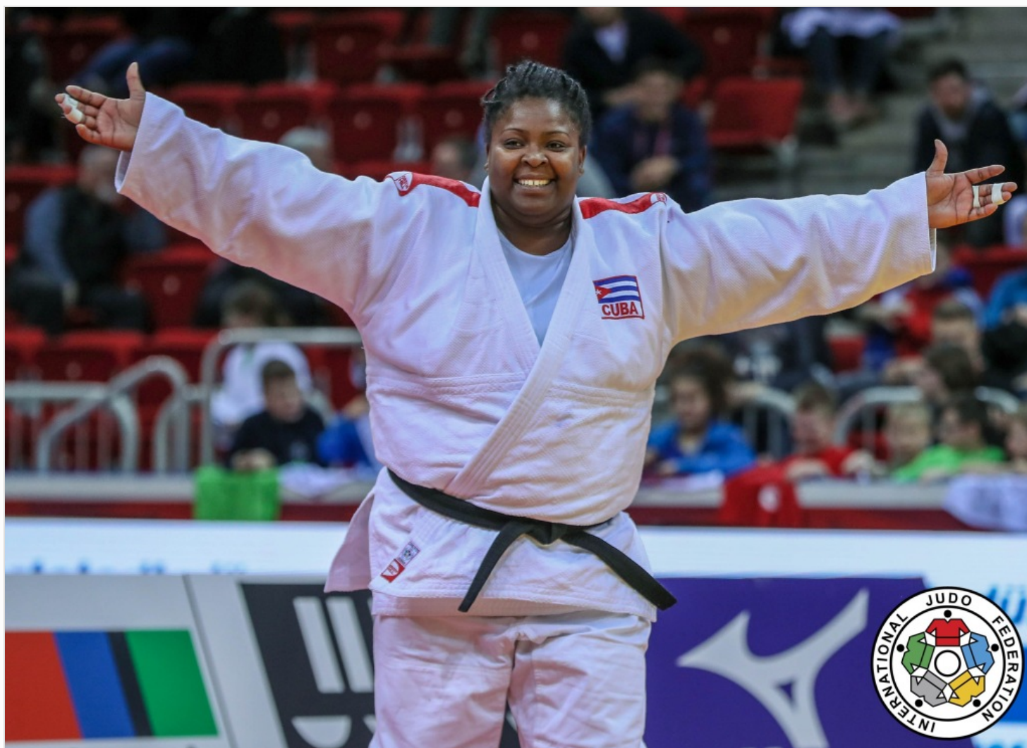
Idalys Ortiz, ocho veces medallista mundial y tres veces en podios olímpicos.

Nuestra campeona olímpica de Londres 2012 ha tenido una temporada casi perfecta y suma 8 560 unidades en esa lista universal, por delante de la francesa Clarisse Agbegnenou (63 kg- 8150) y la canadiense Christa Deguchi (57 kg- 7985); en tanto ningún representante varonil tampoco la supera, pues el que más unidades acumula es el español Nikoloz Sherazadishvili (90 kg- 7255).