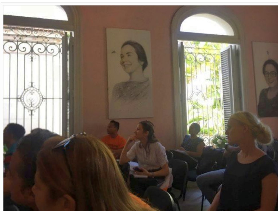
La presentación se hizo en la Sede de la Dirección Nacional de la Federación de Mujeres Cubanas.

La necesidad de apoyar el proyecto desde las redes sociales fue otro de los aspectos abordados, pues las interacciones más complejas sobre temas de violencia de género y feminismo suceden hoy en la red de redes.