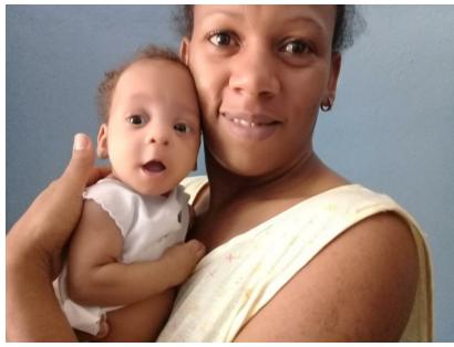
En Santiago de Cuba felices los cuatro (+ Fotos)