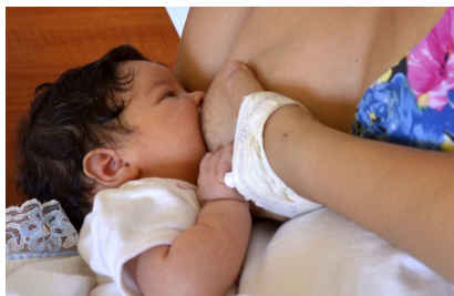
Lactar es salud