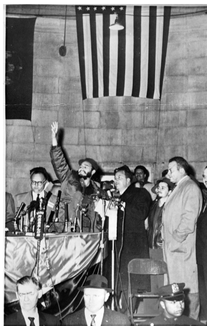
Abanderado del internacionalismo