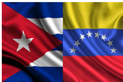
Presidente de Venezuela resalta legado histórico de Fidel Castro