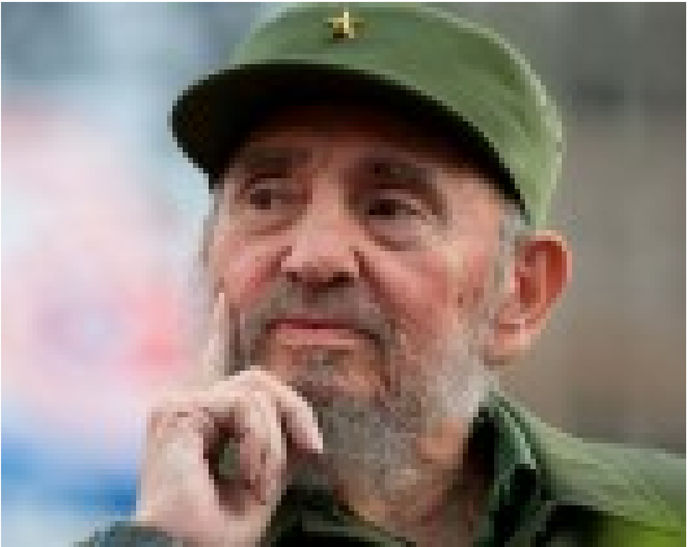
Fidel recordado por los tuneros