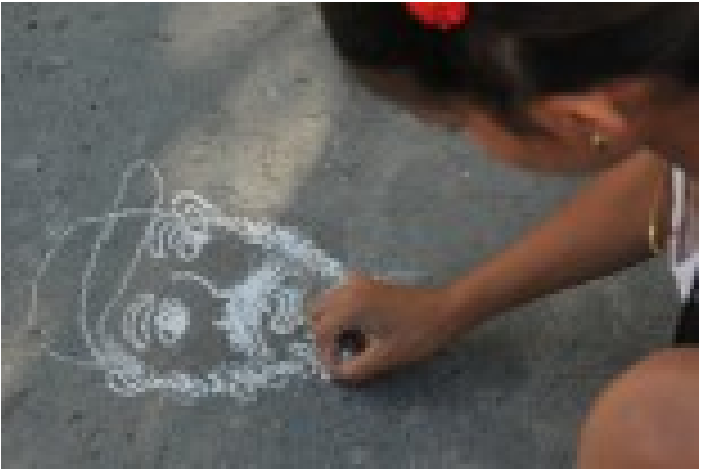
Fidel, vivo este noviembre