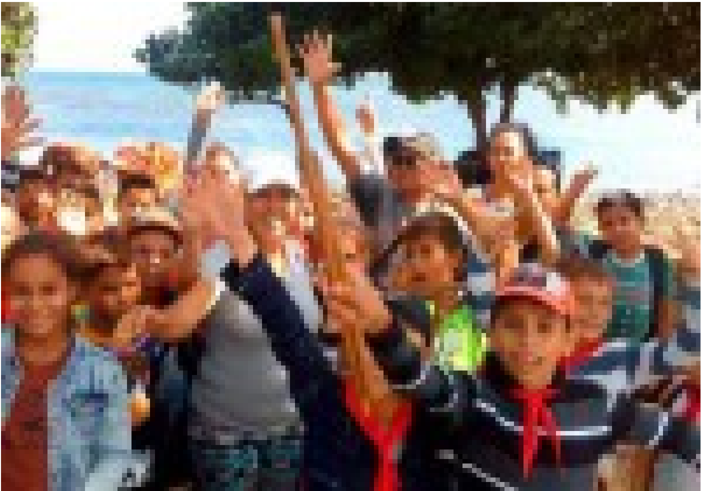
Pioneros y profesores: protagonistas de la Tarea Vida en Puerto Padre