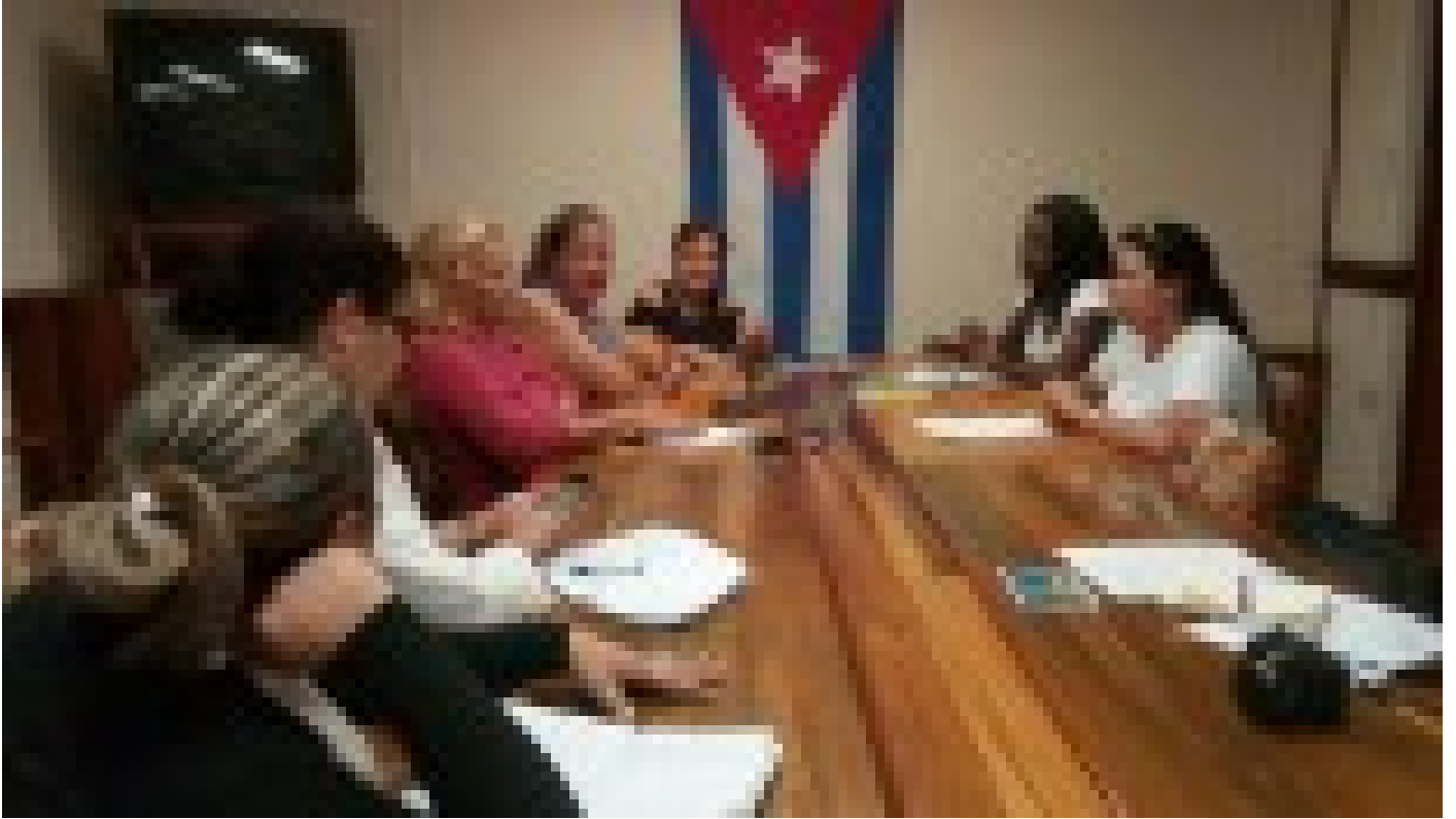
Convocan al empresariado tunero a participar en Plataforma de Soluciones Innovadoras