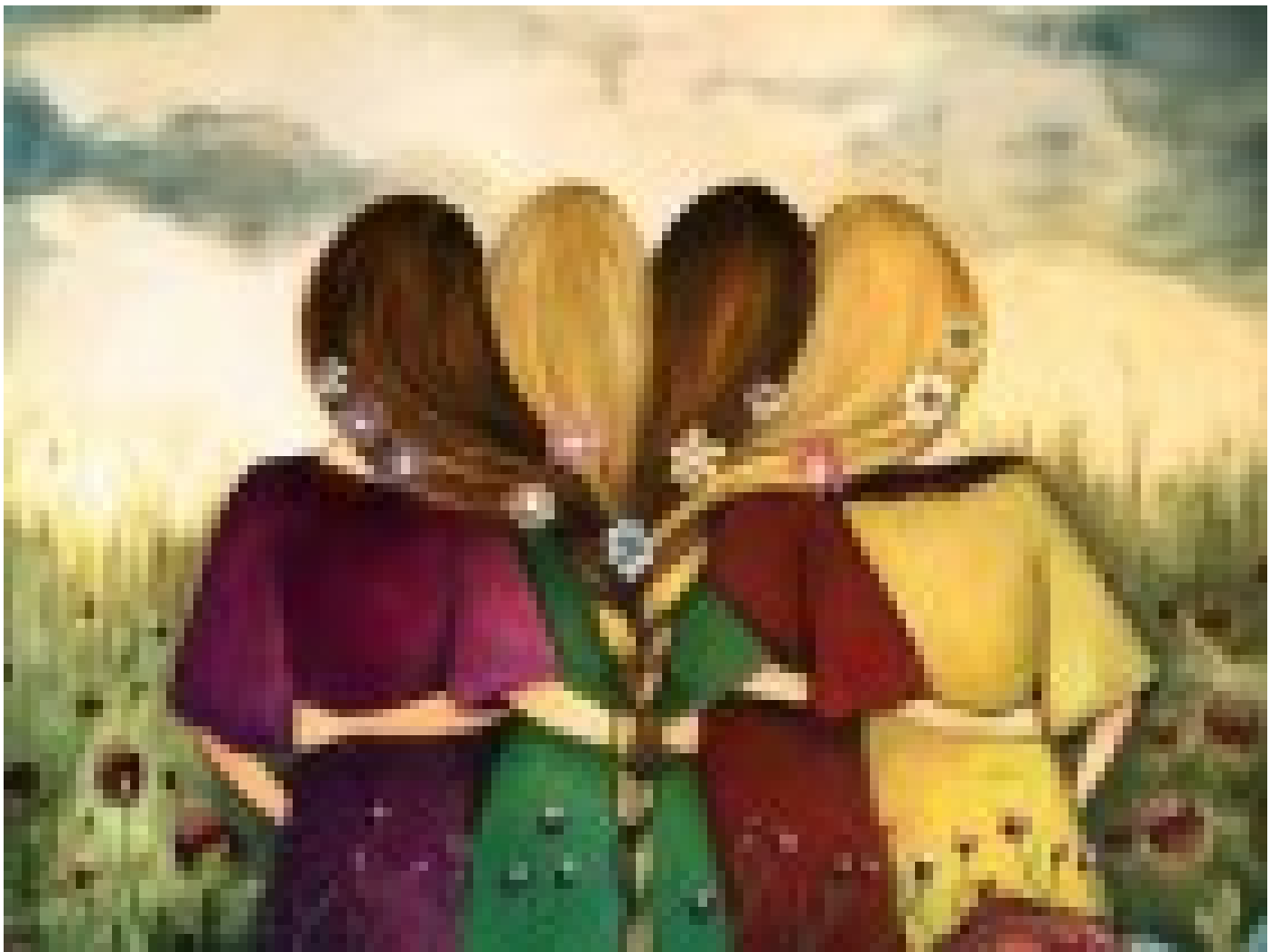
De mujer a mujer