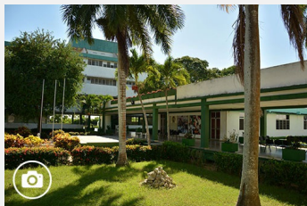
Una escuela que crece