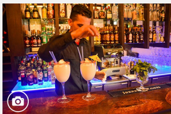
Café Ortúzar, donde se disfruta con elegancia