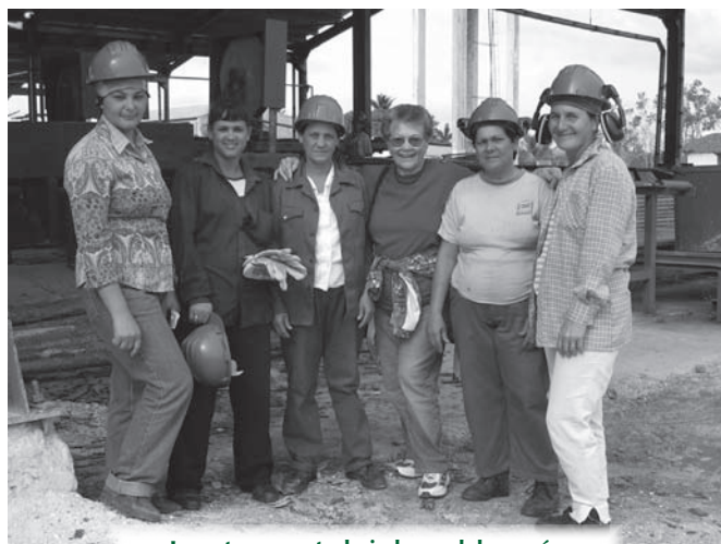
La autora con trabajadoras del aserrío

existen para preservar y desarrollar sus valores económicos y ecológicos. Se cuenta con sistemas estructurados para explotar racionalmente ese patrimonio y cuenta también el país con recursos humanos calificados y dedicados a asegurar la adecuada atención y tratamiento a las plantaciones e industrias.