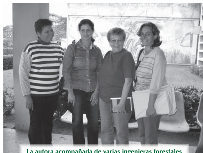
La autora acompañada de varias ingenieras forestales en el Centro Universitario de Pinar del Río

De lo que se habla y escribe poco, o casi nada, es de la presencia y la participación activa de las mujeres en la concepción y ejecución de esos planes. Y ya sabemos que lo que no se menciona, no se oye, ni se ve, ni se lee, es como si no existiera, es sencillamente invisible .