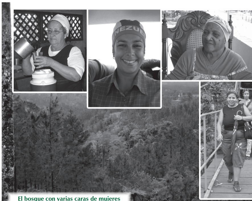
El bosque con varias caras de mujeres

Y más que difícil ignorar a quienes se ocupan de crear, conservar, aprovechar y aumentar esa riqueza natural del país. Se sabe o presume que esas personas están ahí. No siempre aparecen en fotos, postales, reportajes o noticias donde se llama a velar y proteger recursos tan valiosos para la conservación de la especie humana y demás especies pobladoras del planeta -por cierto, casi en peligro de extinción- que compartimos. Esa realidad, la natural y la construida, es el espacio de convivencia social y laboral donde miles de ciudadanos cubanos de ambos sexos tienen su medio de vida y también su modo de vivir. Ellos, con sus familias respectivas, conforman el así llamado sector forestal de la agricultura nacional, que igualmente y con más acierto, podríamos nombrar como la comunidad de mujeres y hombres que trabajan en el manejo de los recursos forestales del país.