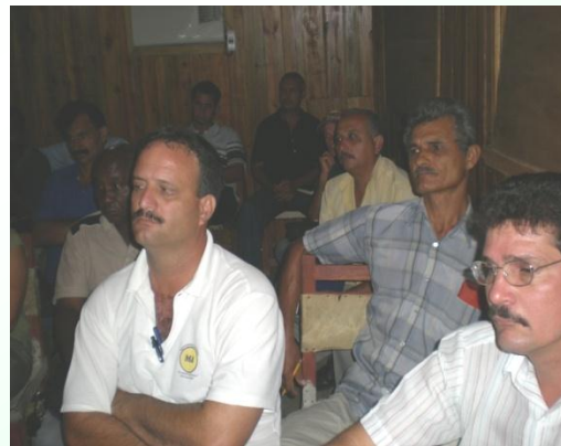
Taller Municipal Mantua