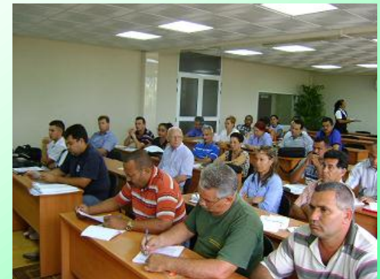
Taller Municipal Bayamo