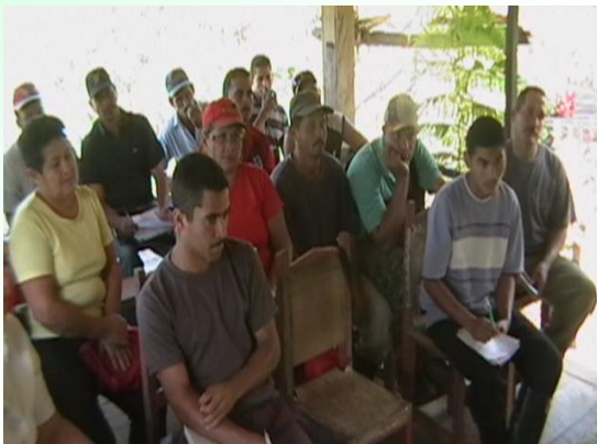
Taller Municipal Jatibonico