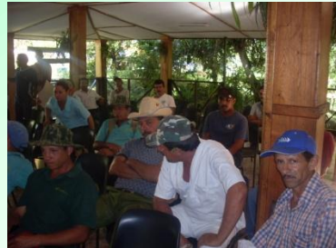
Municipio Bartolomé Masó