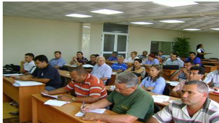
Taller Provincial Granma