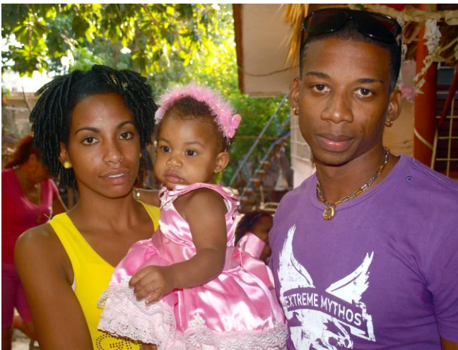
Ambos padres adolescentes.

Los datos recogidos muestran que los 31 hombres con quienes las adolescentes concibieron su primer hijo (independientemente de si tenían en esos momentos una relación de pareja sexual), poseen edades comprendidas entre los 18 y 41 años; siendo el grupo etáreo de 20-24 años el de mayor por ciento (54.8% que representa a 17 padres). La edad más frecuente para arribar a la paternidad resultó ser entonces los 23 años (19.4% conformado por 6 papás), y solo 2 (6.5%) de estos hombres se iniciaron en el rol paterno durante la adolescencia tardía (a los 18 años).