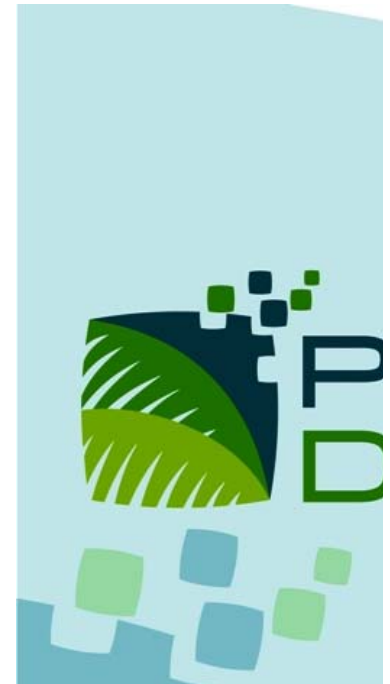
Portadas del Caimán Barbudo

Además ¿quién se atreve a desconocer que miles y miles de mujeres pierden hoy la vida no por inconveniencias de su género o el