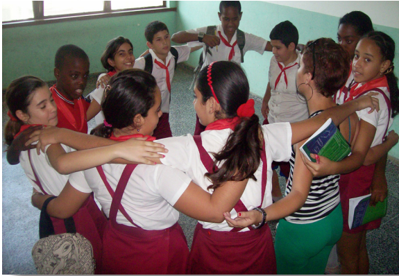
a. Abrazo colectivo