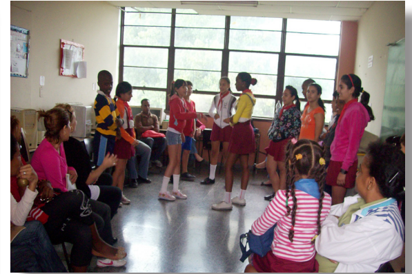
c. Presentación del matutino en el Consejo de Padres Delegados de la escuela