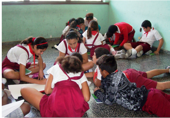
b. Trabajo en equipos