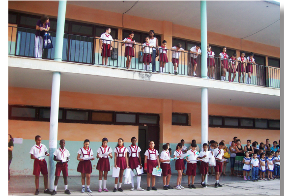
h. Premiación del concurso, 4 de abril del 2013