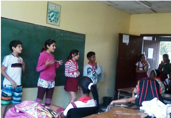
d. Charlas o "asaltos" a las aulas