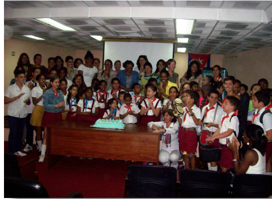
g. 4to Aniversario de la Red ENSI-Cuba