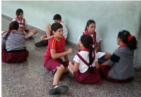
e. Entrevistas a estudiantes no participantes