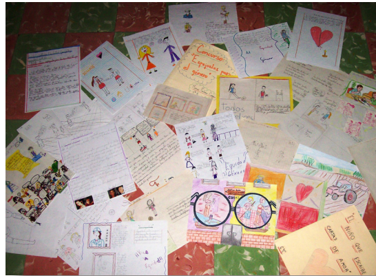
i. Obras del concurso "Ponte tus espejuelos por la equidad de género"