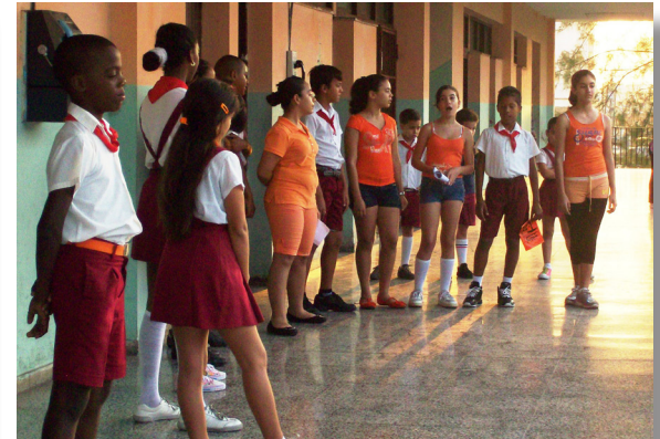
f. Matutino por el "Día Naranja"