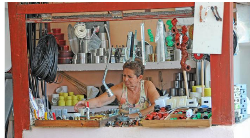
También las mujeres de edad tienen su espacio.

Los cambios que han ocurrido en Cuba -con la educación de las mujeres, el acceso al trabajo y al mundo profesional- fueron revolucionarios porque vinieron acompañados de mejores estándares de vida para ellas y de un mayor reconocimiento social.