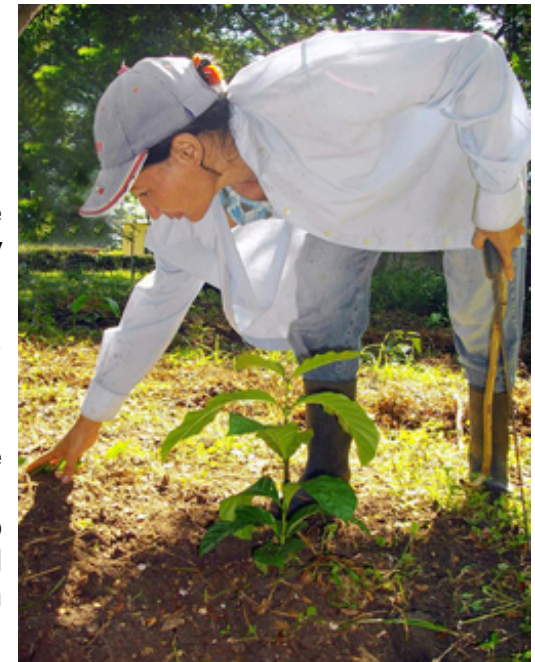
Jamás en el entorno productivo rural ha estado ausente la mano de la mujer cubana.