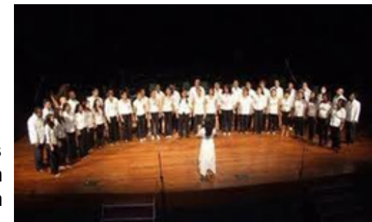
Coro Nacional de Cuba. Foto tomada en Internet

Más tarde su labor se extendió por otros centros estudiantiles hasta dirigir en 1952 un coro gigante de 700 voces con niños de