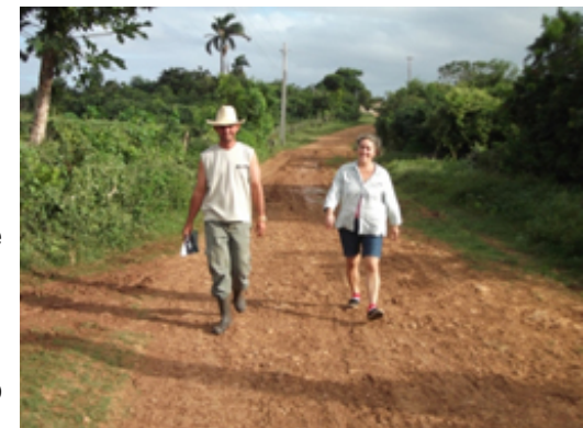
Las mujeres tienden a ser minoría en el espacio rural

"En ocasiones las personas siguen los planes de desarrollo gubernamentales y, otras, la lógica de las necesidades y aspiraciones