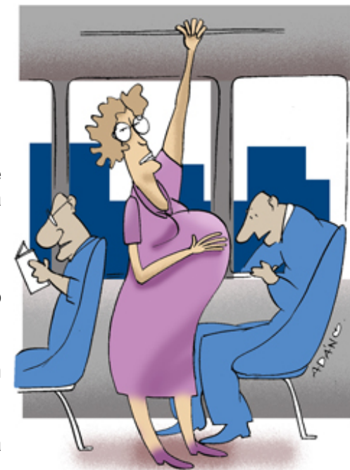
La caballerosidad se está perdiendo.

¿Qué pasa, como lo he visto, cuando la cantidad de embarazadas, en una guagua, supera la cantidad de asientos destinadas a