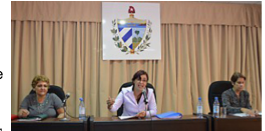
Mujeres directivas en la provincia de Mayabeque