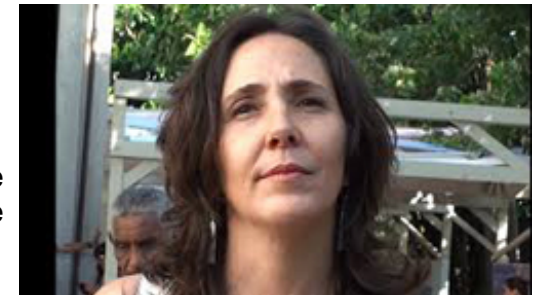
Mariela Castro, directora del Centro Nacional de Educación Sexual de Cuba, es la mayor promotora en el país de los derechos de la comunidad LGTB.

Mariela Castro, directora del Centro Nacional de Educación Sexual, CENESEX, ha estado al frente de las actividades, ya que ella impulsa en el país un conjunto de propuestas legislativas a favor de la comunidad LGTB.