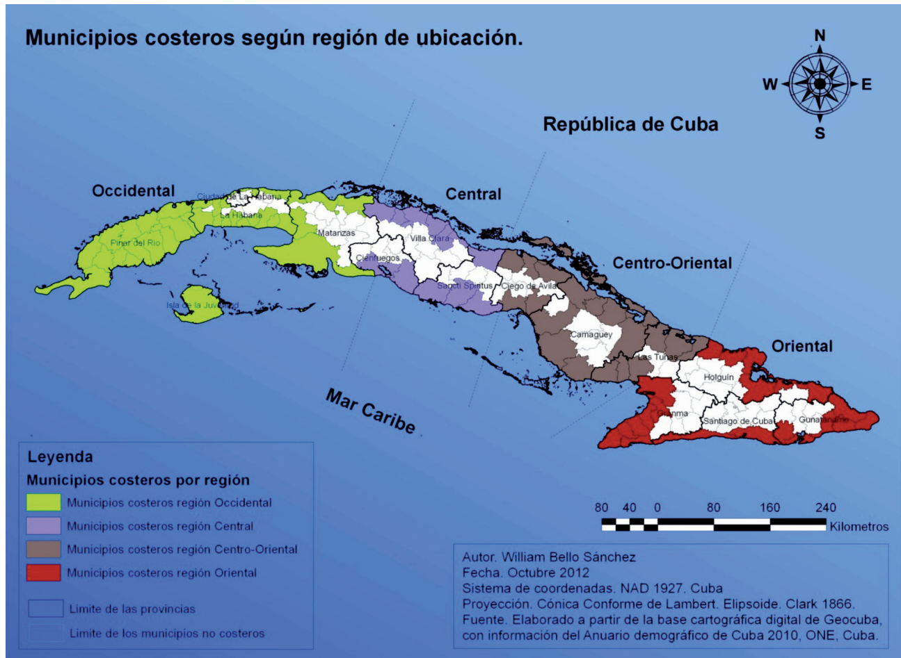
Figura 1. Municipios costeros de Cuba, 2010