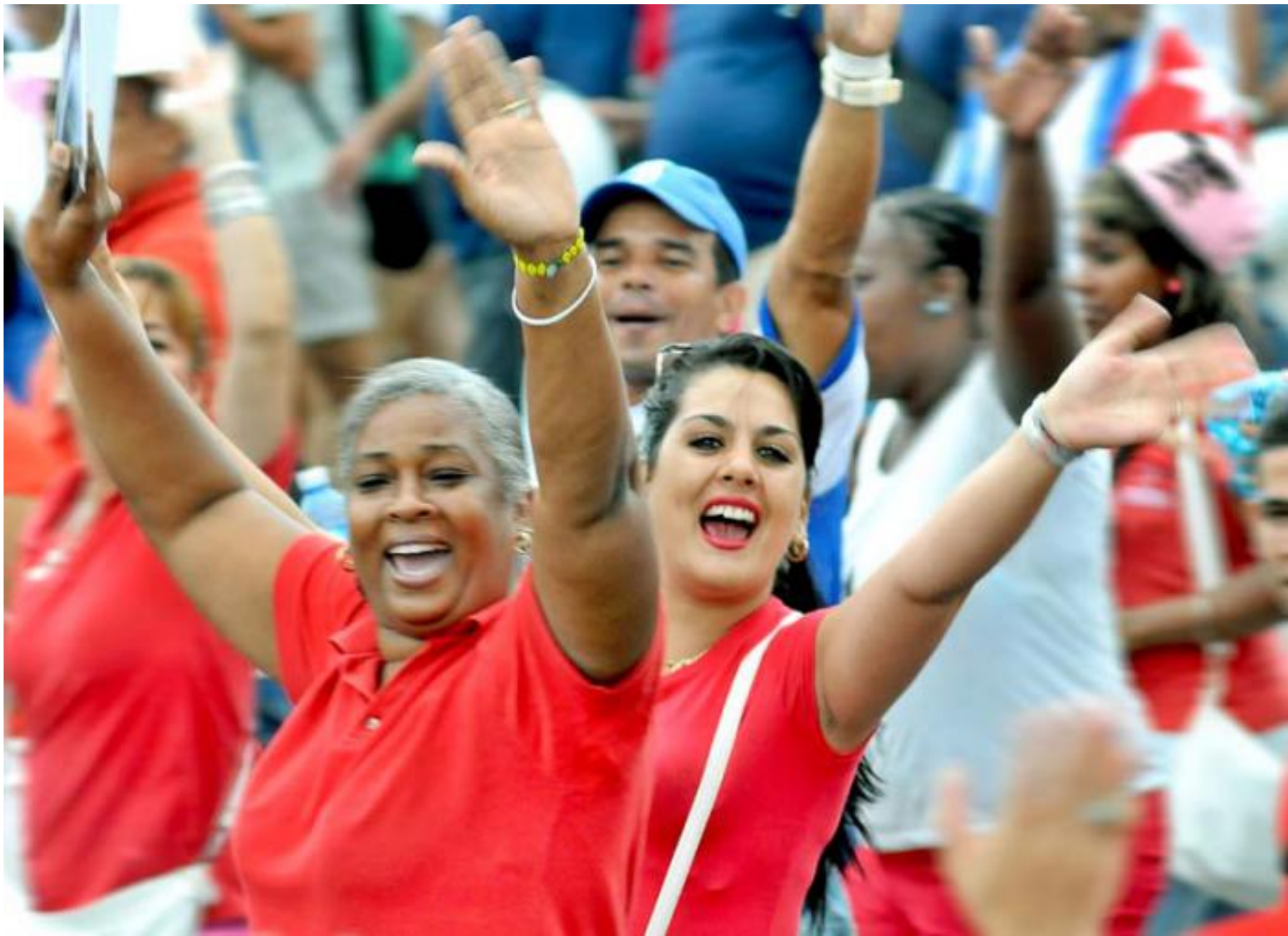
Las mujeres son protagonistas de todos los capítulos de la vida económica y social cubana.