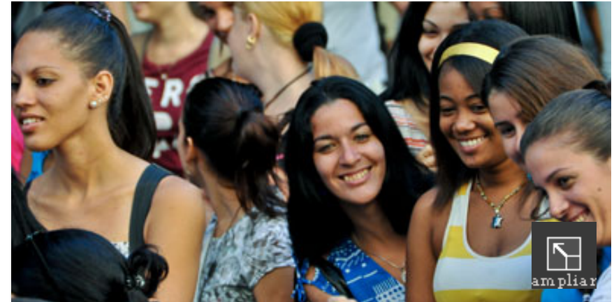
La existencia de un sistema de Defensa Civil en Cuba posibilita la amplia participación de la mujer en todas las tareas en interés de la reducción de los desastres.

También se habló de la necesidad de una mirada más profunda, integral y multidisciplinaria desde los decisores, estudiosos y la sociedad que tenga en cuenta sus debilidades y necesidades.