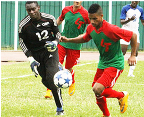
Fútbol cubano: Las Tunas vence a un Sancti Spíritus endeble

Granma vence a Pinar del Río en la Serie Nacional de Béisbol