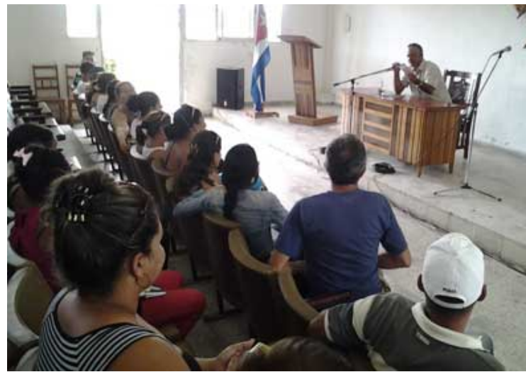
La crítica artística literaria intenta abrirse paso en Las Tunas