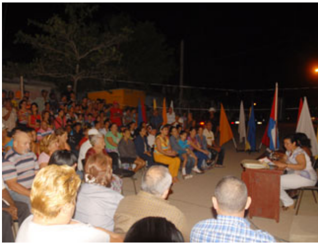
Elecciones parciales cubanas: Con buen pie el primer paso