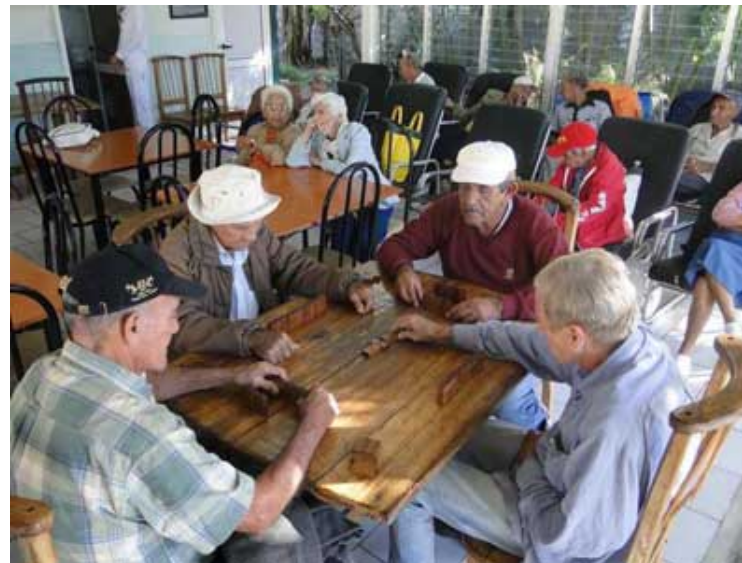
Acciones en Amancio para proteger a la población envejecida