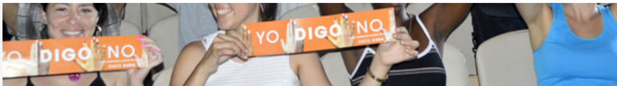
Los estudiantes de la Universidad Central se unieron al llamado de no violencia contra las mujeres y las niñas.

«Nunca nos cansaremos de estar en muchos sitios y de mostrar que somos muchas personas las que rechazamos la violencia. Se trata de que cuando ellos se presenten en los medios de comunicación puedan ofrecer un mensaje diferente y así liderar una opinión. O sea, utilizar esa fama o su repercusión pública, para intentar influir en las personas.