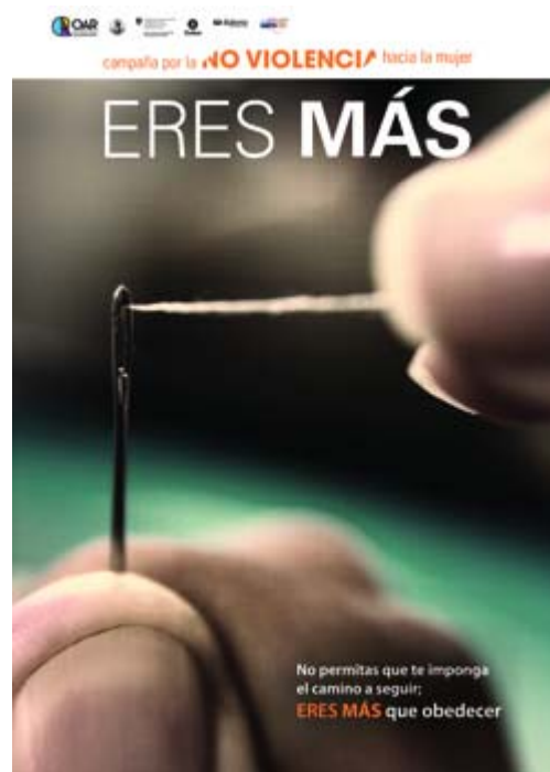
Fotos: Carteles de la Campaña por la no violencia hacia la mujer