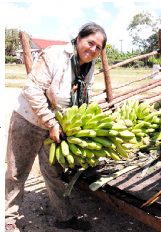
Es reconocido el papel de la mujer en la producción de alimentos.