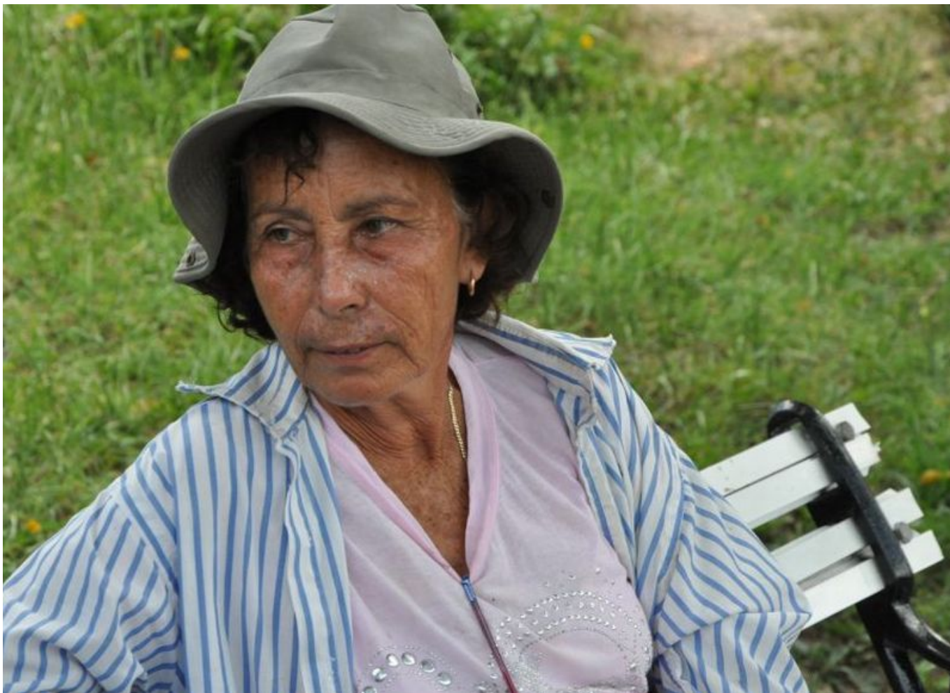
Mi pasión es la jardinería, sin ella no viviría.

“Yo nací en Las Lajitas, entre Manicaragua y Fomento, soy la tercera de cuatro hijos de un matrimonio guajiro. Mi vida siempre ha sido el campo, aprendí a trabajar la tierra, a enyugar bueyes, aparejar caballos; pero también estudié, soy económica y lo ejercí unos cuantos años hasta que decidí buscar otros horizontes con la siembra de viveros de plantas ornamentales y frutales, así comencé”.