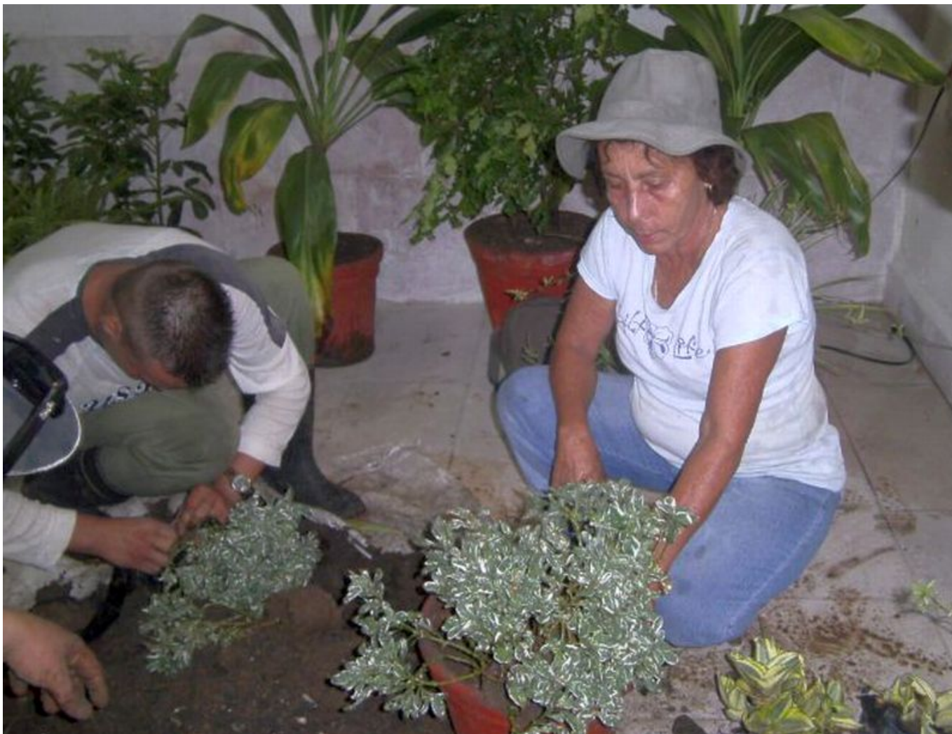
Los colectivos laborales también reclaman sus servicios de ornamentación.

Nadie puede imaginarla fuera del entorno que la envuelve y le consume la mayor parte del tiempo. Sus días se hacen largos, con jornadas agotadoras y compromisos que no esperan. El celular no deja de sonar y con las manos llenas de tierra atiende de inmediato cada llamada.