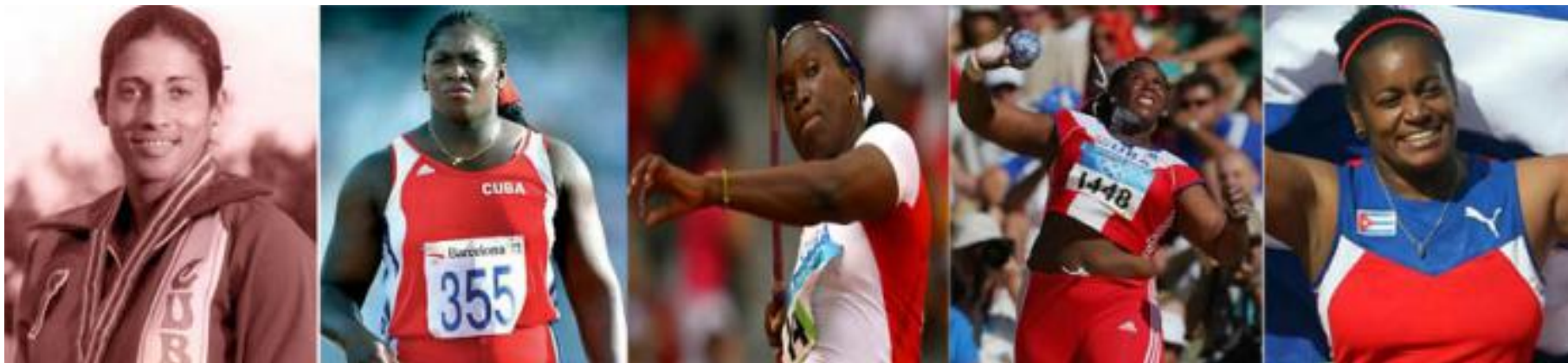
De izquierda a derecha, María Caridad Colón, Maritza Martén, Osleidys Menéndez, Yumileidis Cumbá y Yipsi Moreno.