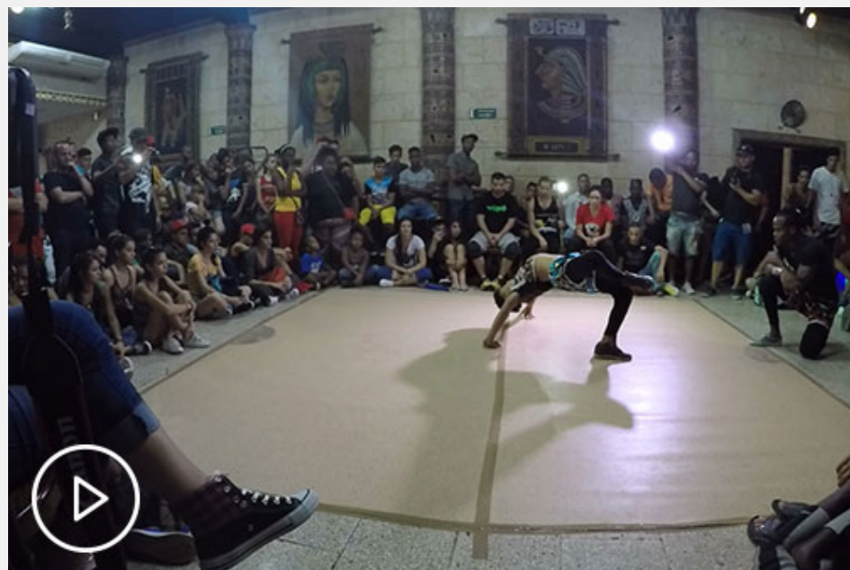
Pinar del Río y la fiesta de bboying