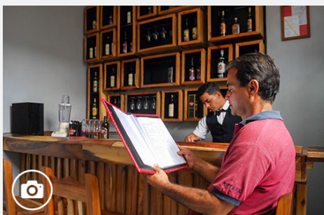
¿Qué trae la casa del vino en Pinar del Río?