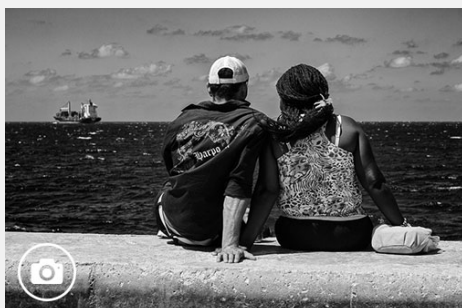
El amor de cada día