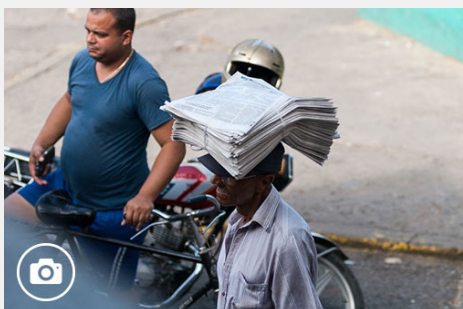
El pinareño es así