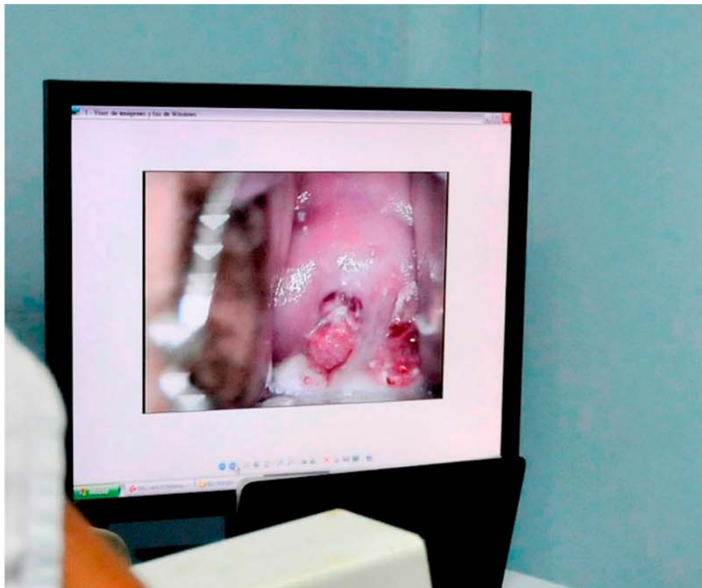
La Neoplasia Cervical Intraepitelial es un crecimiento anormal y pre-canceroso de células escamosas en el cuello uterino.

(/guantanamo-cuba-noticias-nacionales/6560-nombrados-nuevos-ministros-de-economia-y-educacion-superior)