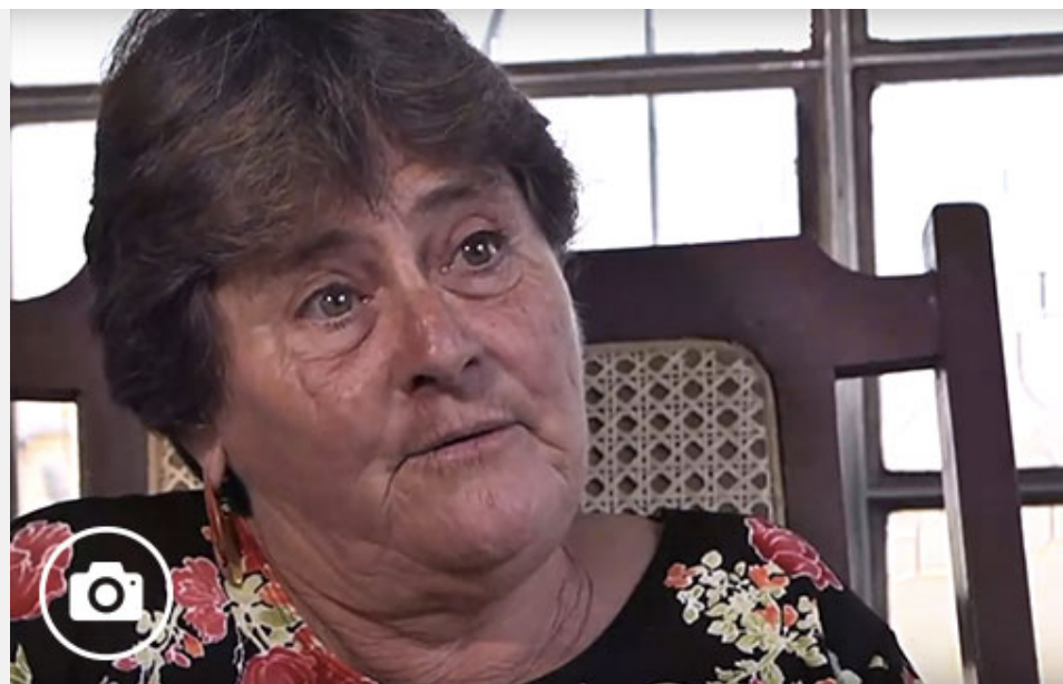
Maestra de maestros