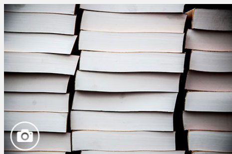
Días con olor a letras