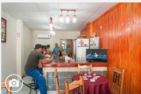
Reabren locales gastronómicos y de servicios en Pinar del Río