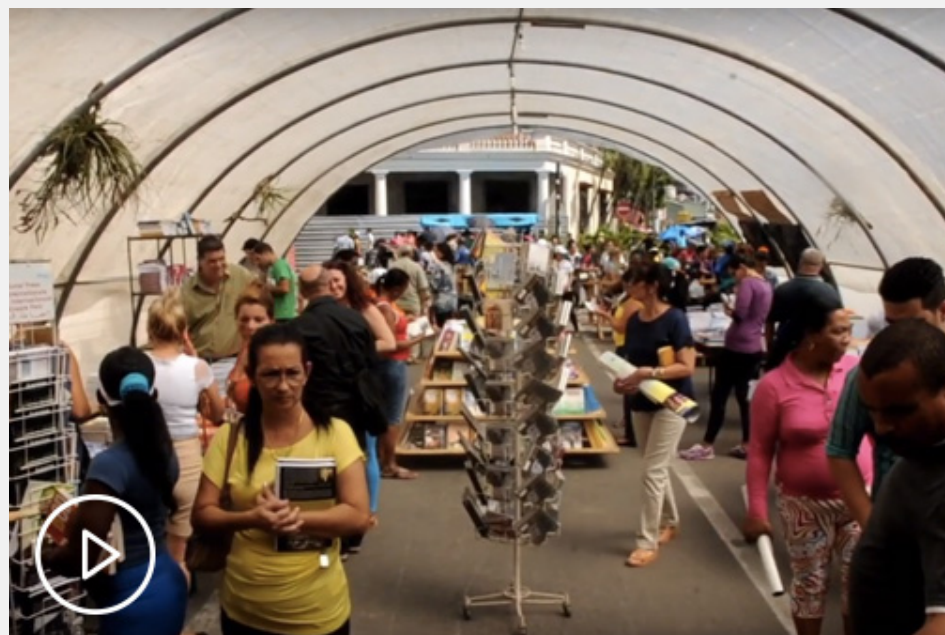
Feria del Libro 2017 en Pinar del Río