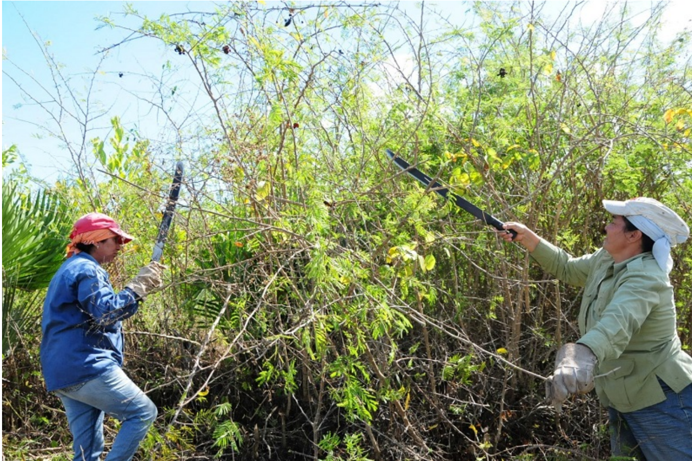
Estas mujeres son expertas en chapear marabú.

machete antes que trabajar en la siembra o reforestación de las áreas, eso sí se las trae, porque uno debe caminar detrás del tractor con las manos llenas de bolsas, primero regando las posturas y luego sembrándolas; ¿y qué decir del carbón?, cuando nos toca hacerlo debemos cortar los troncos de aroma, conformar el horno, velarlo y cosecharlo, por suerte, los tres hombres que integran esta brigada nos ayudan bastante”, confiesa.