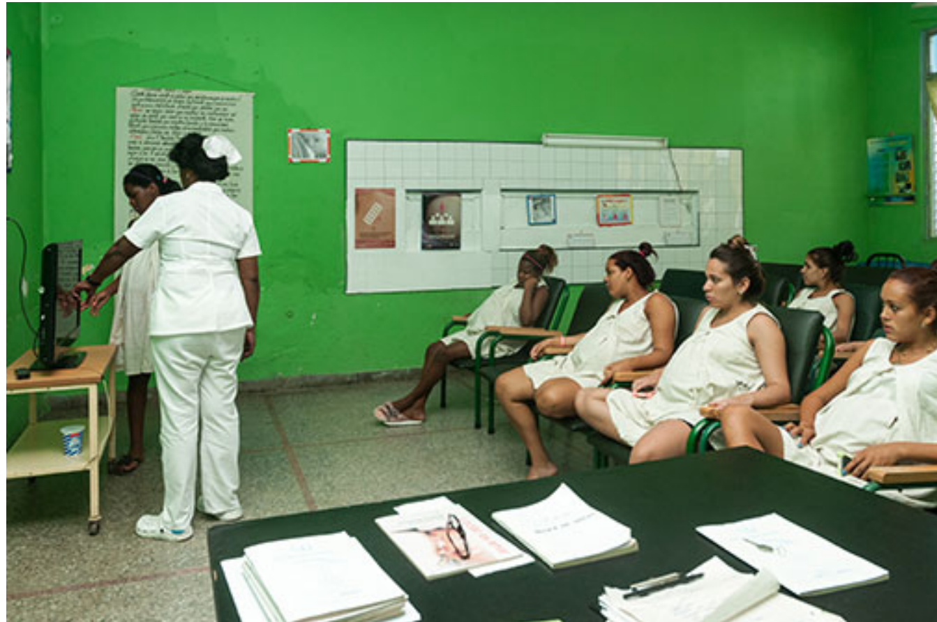
En su aula se ofrece promoción de salud. En la imagen, una enfermera explica

Así se complementa el sistema de salud pinareño, cuyos logros son la suma del esfuerzo de muchos durante años y con el personal calificado que le añade aún más valor a este propósito: la natalidad feliz.