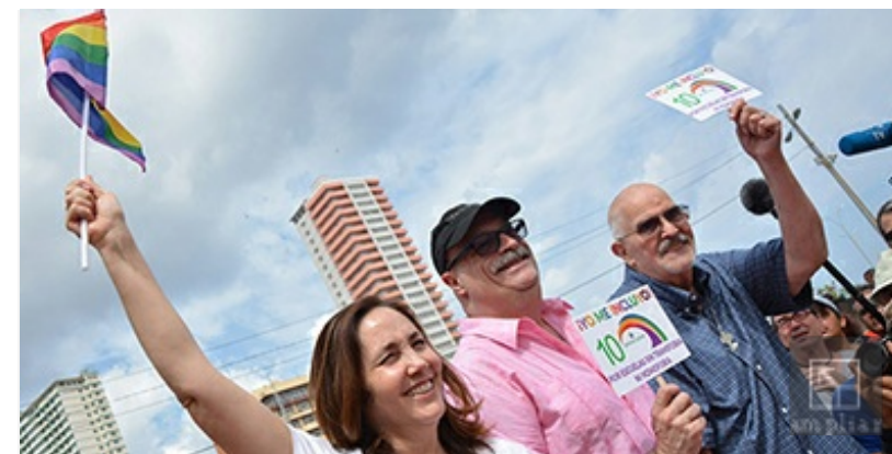
Mariela Castro encabezó el desfile.