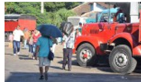
Paulatina recuperación en servicios de transporte no estatal