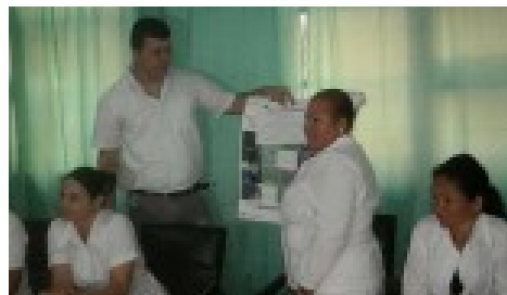
Heberprot-P extiende sus bondades a más de 900 pacientes en Las Tunas