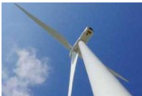
Potencialidades de Las