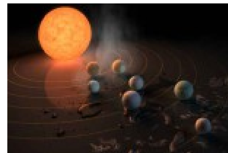
La NASA descubre un nuevo sistema solar con siete planetas que podrían albergar vida