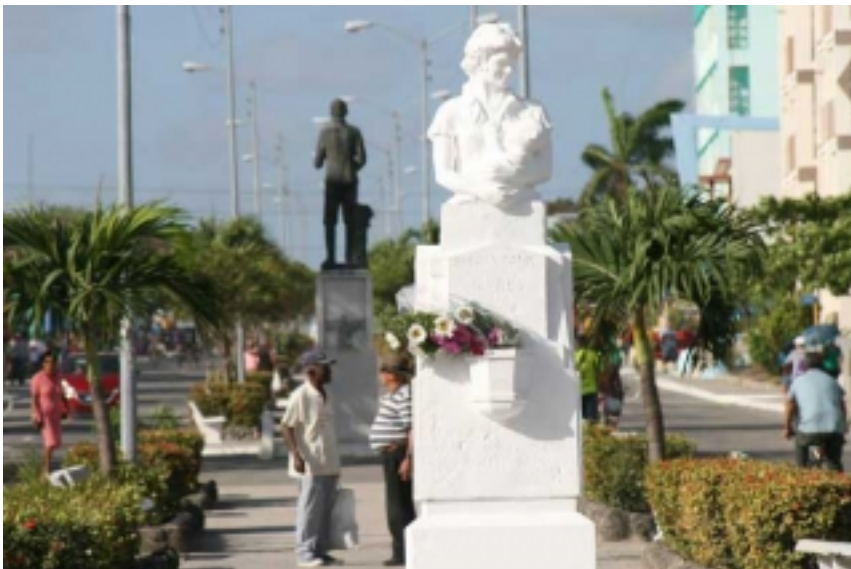
Restauran Busto de las Madres en la Villa Azul de Cuba (+Fotos)

Abierta en Chaparra la mayor tienda recaudadora de divisa de su tipo en los municipios