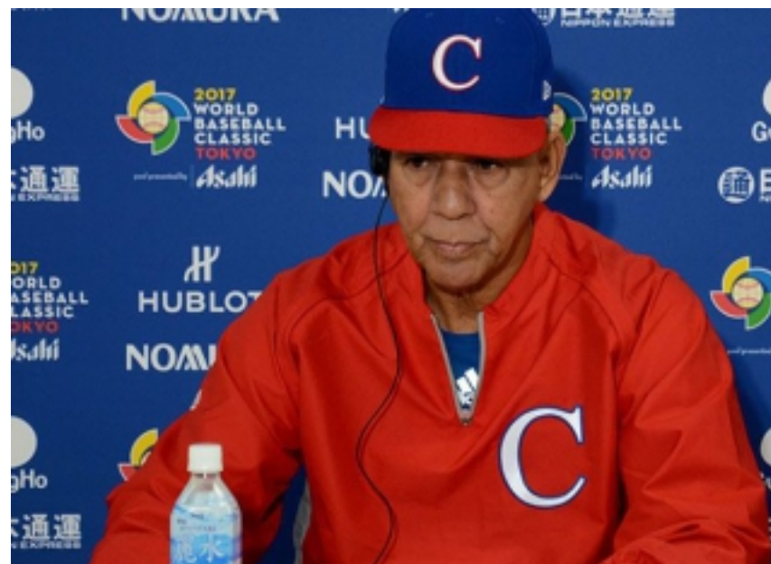
Crónicas Clásicas: La derrota como método