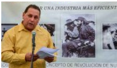
Muebles Ludema, ejemplo de Empresa Estatad Socialista