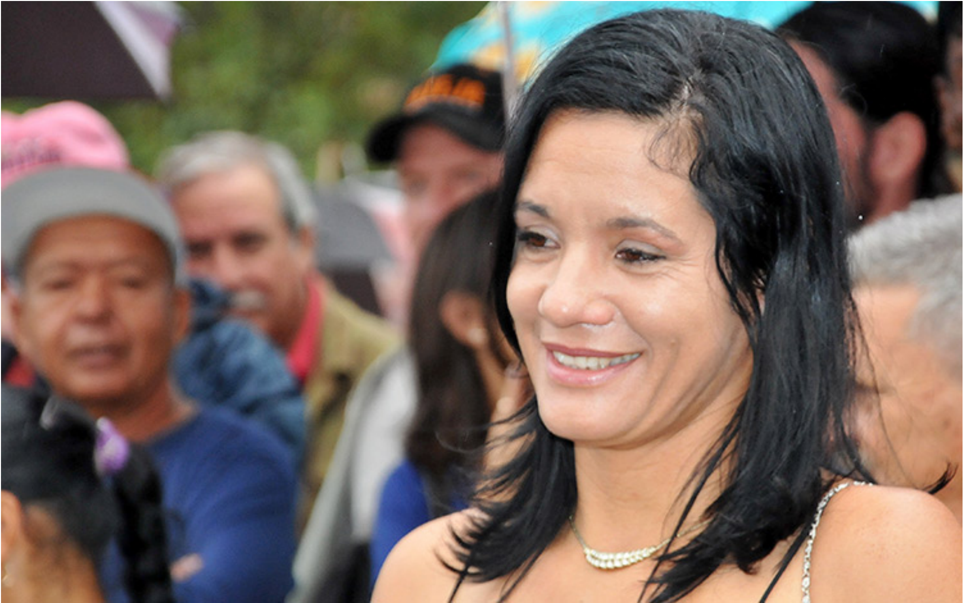
Emocionada, la Yoya se despidió de su afición este 22 de febrero, en Santa Clara.

terminado en el puesto 18 en la carrera por puntos, me trataron mal, no me dieron ni masaje. Al otro día salí a competir, el entrenador prácticamente no me habló y conquisté el título mundial.