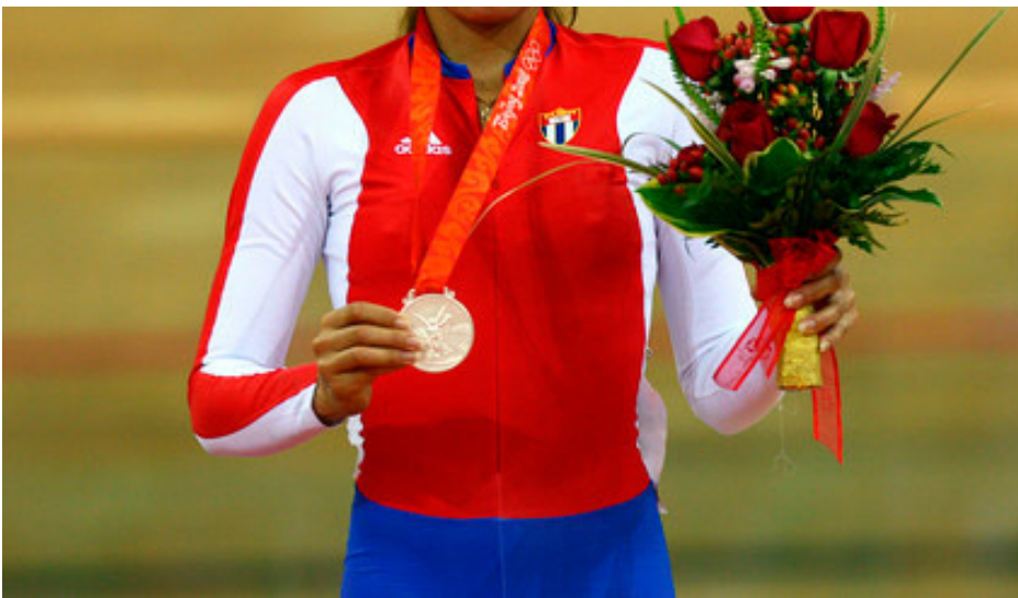
Inolvidable la plata olímpica de Beijing.

y del Caribe de 2006 y de las fases de la Copa del Mundo regresó vestida de oro de Moscú, en 2005, cuando triunfó en el scratch, y de la ciudad inglesa de Manchester, donde dominó la carrera por puntos, en 2007.