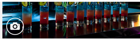
Nuevas luces para mi ciudad