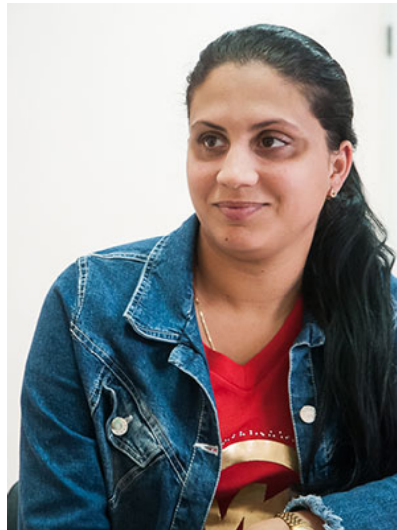
Maday Martínez Maqueira / Foto: Jalirosky Ajete

Maria Elena Núñez Cardentey / Foto: Jalirosky Ajete