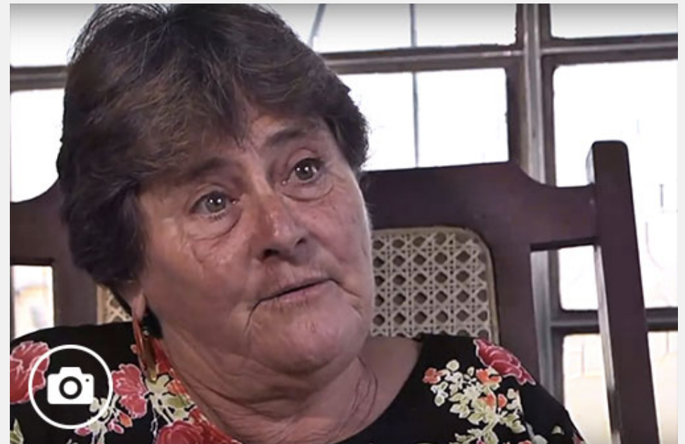
Maestra de maestros