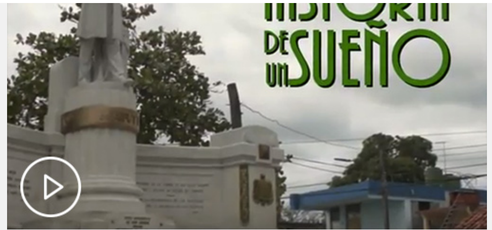
Historia de un sueño