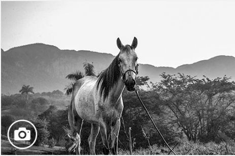
Recorriendo el Valle Dos Hermanas