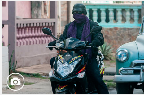
Invierno en Vueltabajo