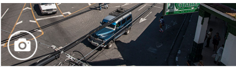
Pinar del Río desde lo alto