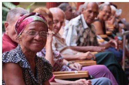
Para 2018 serán 40 años que en Cuba la tasa global de fecundidad no alcanza la cifra de 2,1 hijos por mujer. La proyección para el año 2030 es que el 30,3 % de la población cubana tendrá 60 o más años.

«La cuarta medida es extender a los abuelos maternos o paternos que tengan la condición de trabajadores, el derecho que hasta hoy tenían la madre o el padre, al disfrute de la prestación social. Cuando sean estas figuras —incluido el padre que ya estaba recogido en la legislación anterior— las que decidan acogerse al cuidado del niño vencido el periodo de la licencia postnatal y hasta el arribo al año de vida, van a tener derecho al disfrute de una prestación social