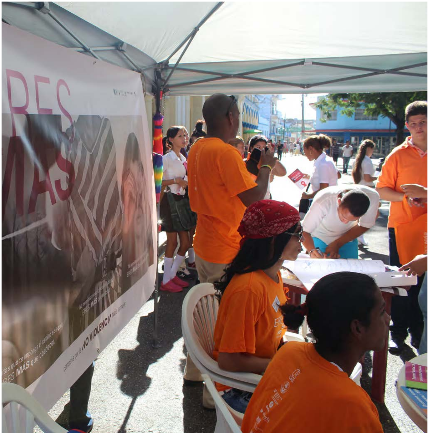
Es necesario ampliar los servicios de consejería que ofrecen proyectos locales y redes comunitarias.

Activistas y expertas también han señalado la posibilidad de crear una línea telefónica para las víctimas. El proyecto continúa en espera, pese a que en el país funcionan con