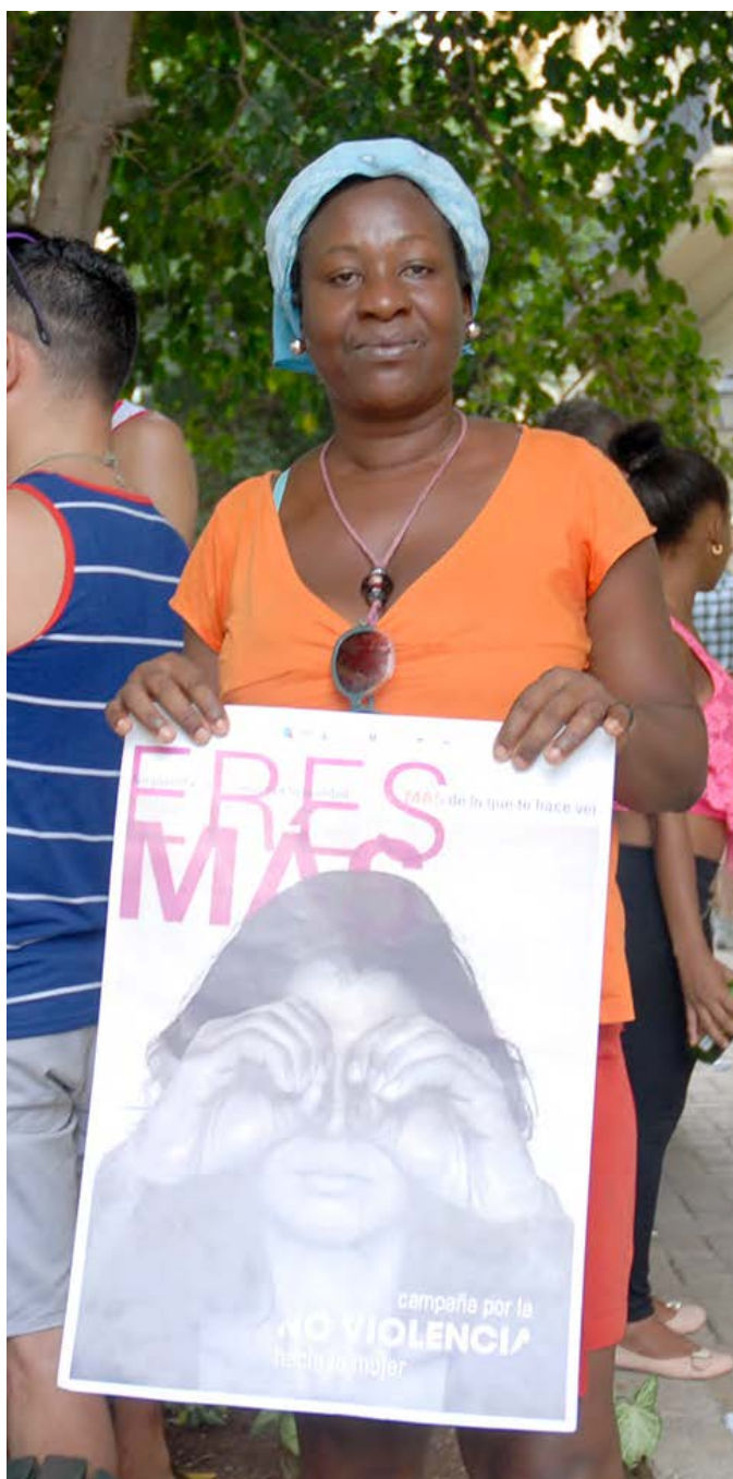
Mujeres y niñas son mayoría entre quienes viven las consecuencias de la violencia machista.

Especialistas de diversas profesiones y activistas por la igualdad de género en Cuba coinciden en la necesidad de implementar una investigación macro sobre violencia de género, que ofrezca luces acerca del alcance y los impactos de este tipo de maltrato en la sociedad.