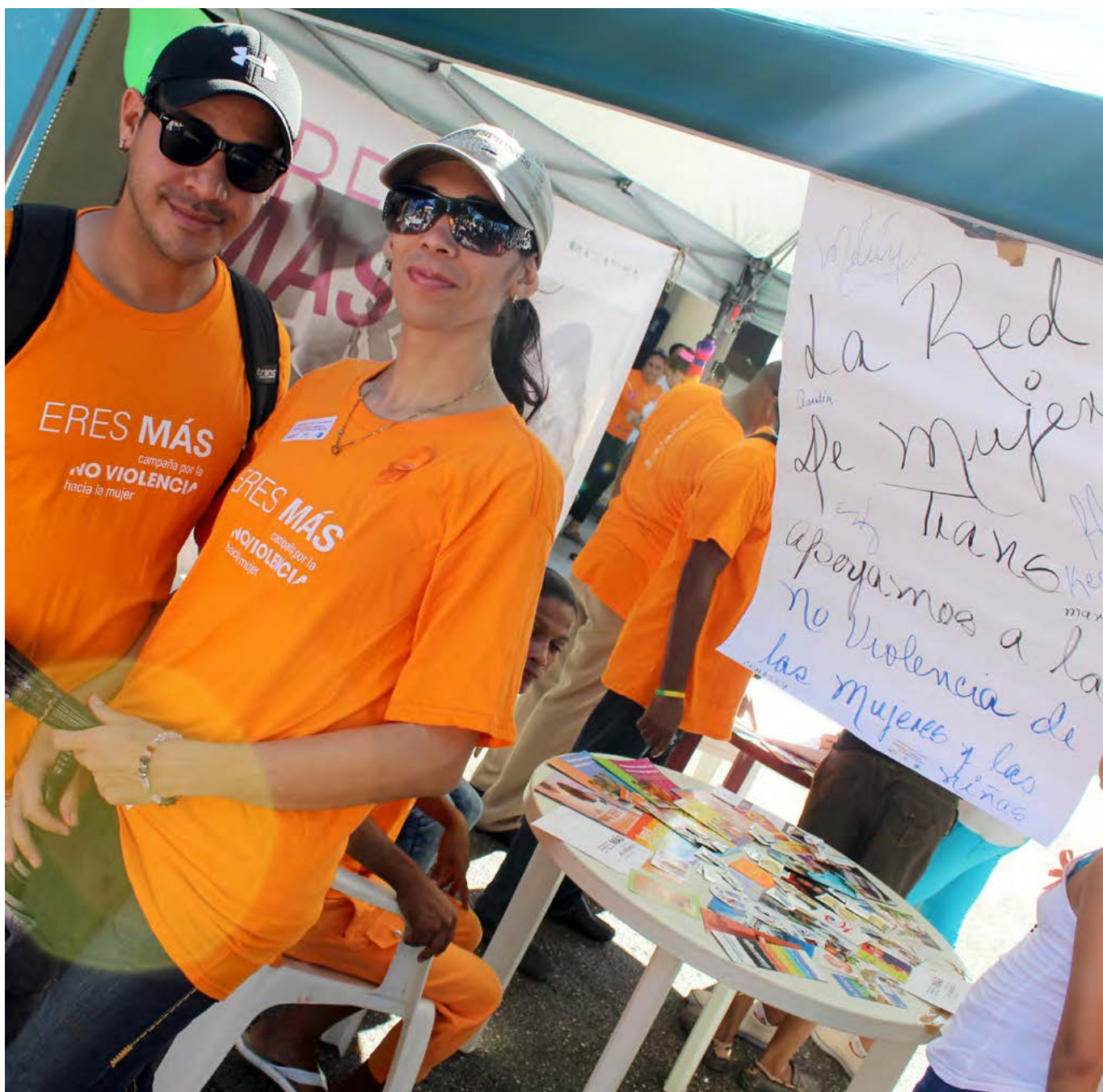
Mujeres trans, lesbianas y bisexuales viven violencia machista y sus realidades también deben tenerse en cuenta.

lencia hacia las mujeres y las niñas, sutilmente todas las personas leen que esas niñas y esas mujeres son heterosexuales, nadie piensa que son mujeres lesbianas y también mujeres transexuales. Hay vacíos y brechas y no se trata de crear etiquetas, pero sí es importante llamar la atención sobre estos problemas.