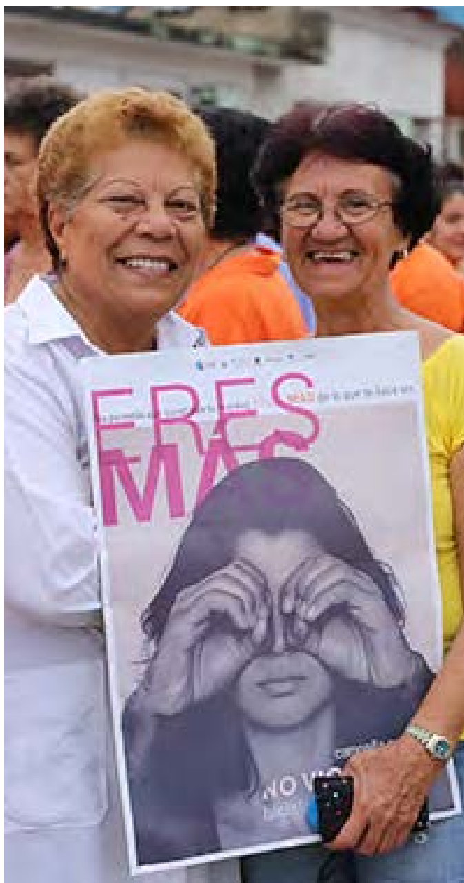
Los mensajes de la campaña ERES MÁS, de OAR, buscan visibilizar la violencia psicológica hacia las mujeres.

La violencia que se ejerce hacia las mujeres y las niñas gana presencia en los medios cubanos de comunicación, pero aún no se aborda suficientemente ni se hace siempre con acierto, en opinión de periodistas y especialistas.