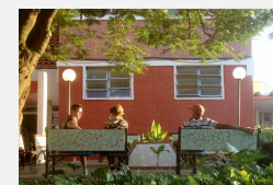
Buenos días, Pinar