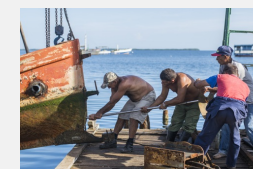
El arte de pescar