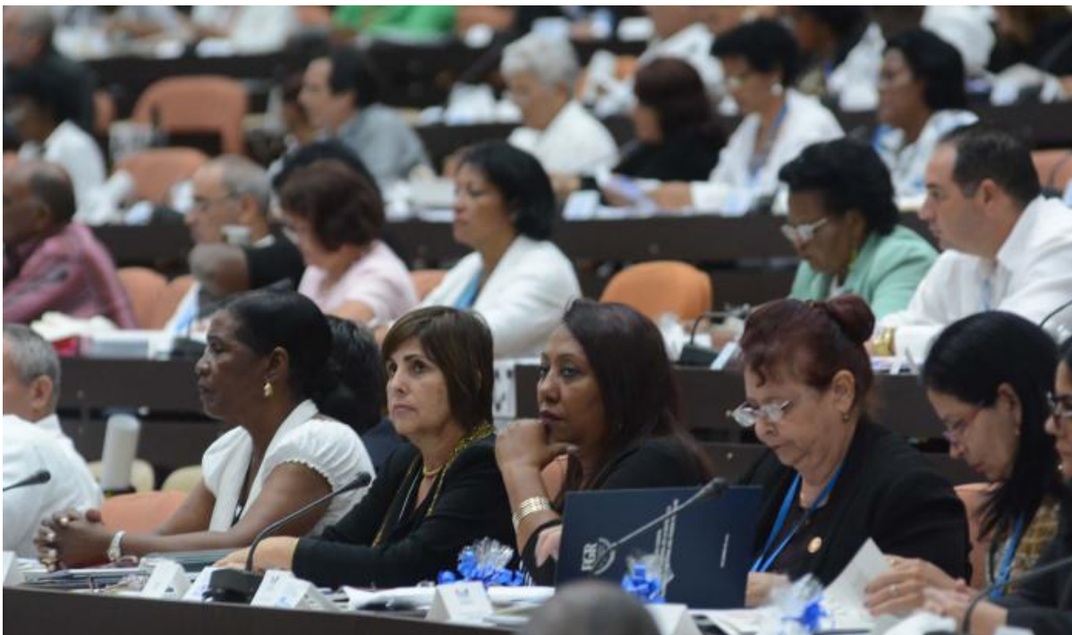
Décimo periodo ordinario de sesiones de la Octava Legislatura de la Asamblea Nacional del Poder Popular.

Cuando en 1993 Fidel analizaba la composición de la Asamblea Nacional del Poder Popular (ANPP) y la participación en esta de un número creciente de graduados universitarios, de negros y mestizos, de mujeres... coincidía en que ello era reflejo del «avance colosal de nuestro pueblo en estos años de Revolución» y representaba, además, «la forma en que ha desaparecido la desigualdad en nuestro país y la discriminación».