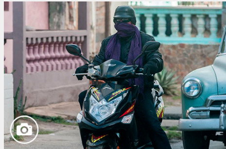
Invierno en Vueltabajo