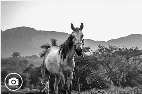
Recorriendo el Valle Dos Hermanas