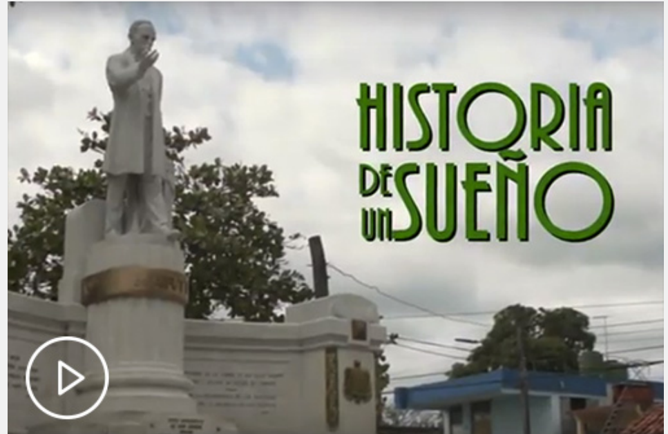
Historia de un sueño