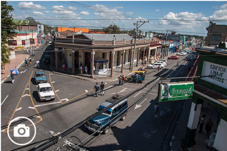
Pinar del Río desde lo alto