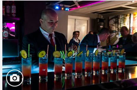
Nuevas luces para mi ciudad