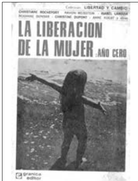
3- La Liberación de la mujer: año cero (1972).