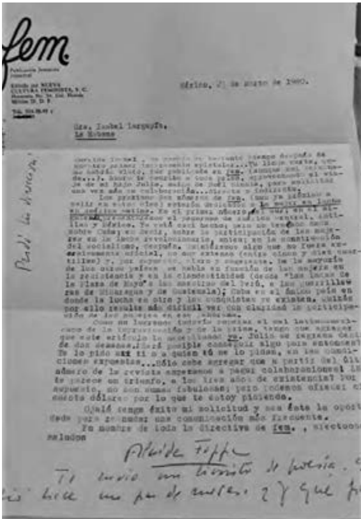
3- Alaide Foppa, poeta feminista, invitando a Isabel a participar con colaboraciones en la revista mexicana FEM. En la correspondencia se ofrece un balance sobre el feminismo y el movimiento de mujeres en el continente. Foppa fue desaparecida ese mismo año, en 1980, por la dictadura guatemalteca.