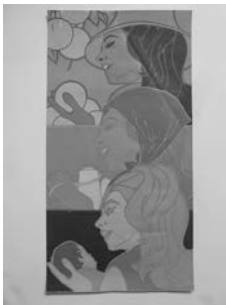
Afiche Día de la Mujer en Cuba. En la misma puede apreciarse la cuestión del "trabajo invisible" y el problema de la doble jornada de trabajo para las mujeres. Imagen; Heriberto Echeverría 1971 COR