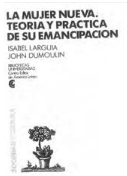
2- La mujer nueva: teoría y práctica de emancipación (1988).