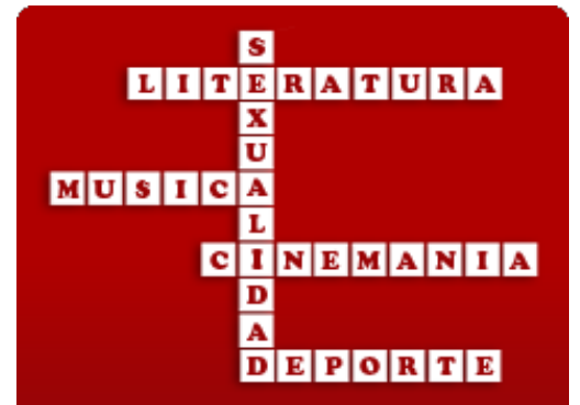
Club de amigos